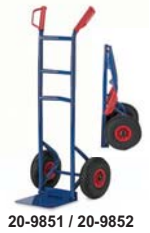
20-9851 / 20-9852