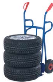
R22-9661 / 62