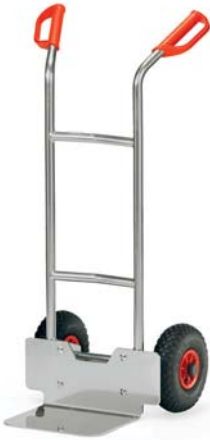
A 1125 L