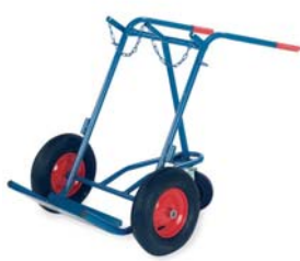
17-9776 / 77