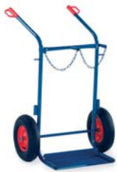
17-9761 / 62