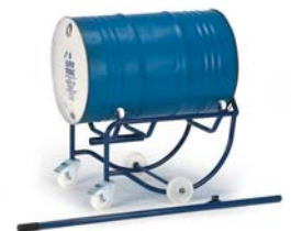
18-3201 (ohne Hebelstange)