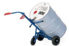
18-3331 / 32

Werkzeugkiste für alle oben genannten Stahlflaschenwagen einhängbar und jederzeit nachrüstbar.