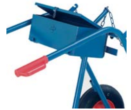
17-0001 / 02 / 03