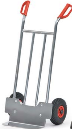
A 1115 L