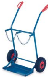
17-9791 / 92