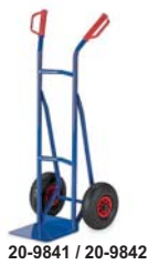
20-9841 / 20-9842