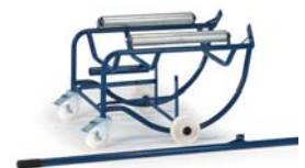
18-3202 (ohne Hebelstange)