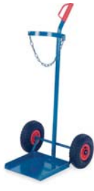
17-9713 / 14