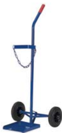
17-9711 / 12