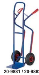
20-9881 / 20-9882