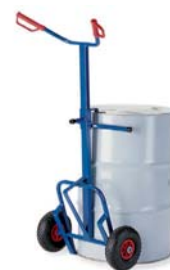
18-3221 / 22