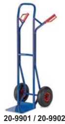
20-9901 / 20-9902