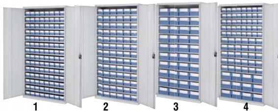
System-schränke mit Volumenregalkästen H 1950 x B 1000 x T 500 mm