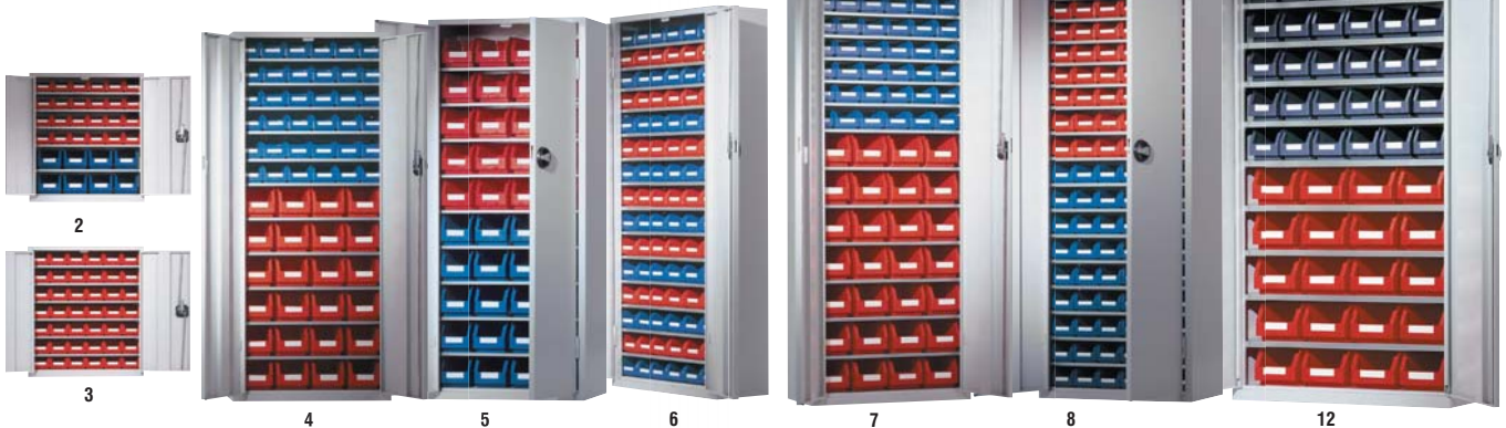
Ordnungsschränke mit RasterPlan Lagersichtkästen