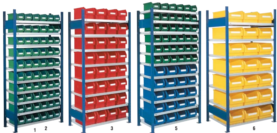
Regale mit RasterPlan Lagersichtkästen