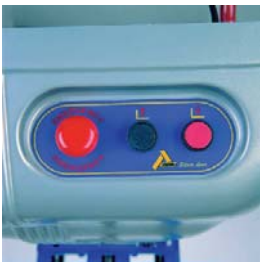
Heben und Senken über Druckschalter.