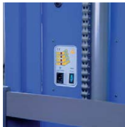
Microprozessor-gesteuertes Batterieladegerät, das man direkt an das Stromnetz mit 220 V anschließen kann.

Jährliche UVV-Prüfung sowie Gerätewartung und Reparaturservice auf Wunsch durch unseren Kundendienst.