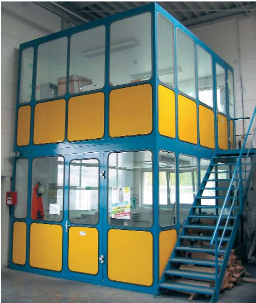
Top-Ausführung in Isolierung nach WSchVO 1995. Schalldämmung bis ca. 38 dB.