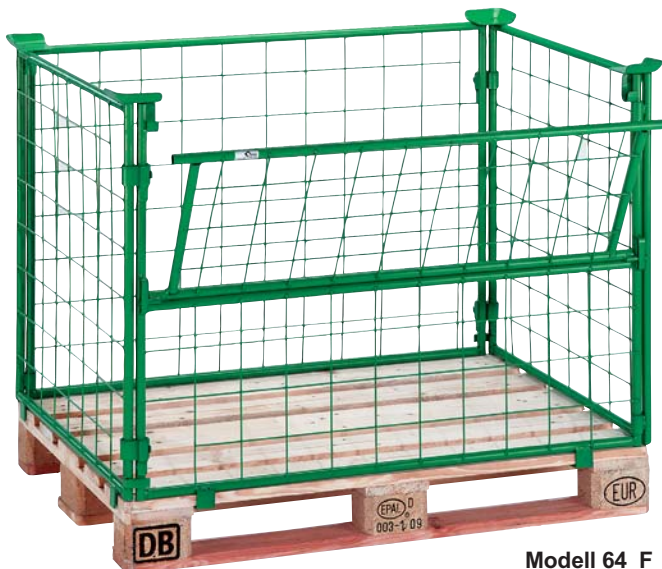
Modell 64 F