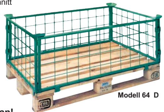
Modell 64 D