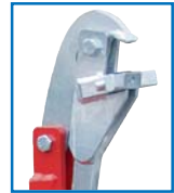
Greifvorrichtung RS 91/1

Lieferbare RAL-Farben: Diese gedruckten RAL Farben geben drucktechnisch bedingt nur annähernd den Farbton korrekt wieder