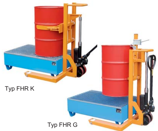
Typ FHR K